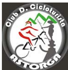
Club D. Cicloturista Astorga

Ruta: Salida del Polideportivo de Astorga a las 10:00 horas (Carretera de Astorga a Val de San Lorenzo)